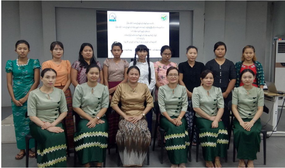
Batch - 7 Group Photo

မြန်မာနိုင်ငံအထည်ချုပ်လုပ်ငန်းရှင်များအသင်း (MGMA) မှကြီးမှူးပြီး တစ်ဆင့်မြင့်မော်တာစက်ချုပ်သင်တန်း (သင်တန်းအမှတ်စဉ် - ၇) ကို ၂၀၂၄ ခုနှစ်၊ ဇွန်လ ၂၄ ရက်မှ ဇူလိုင်လ ၅ ရက်ထိ၊ မြန်မာနိုင်ငံအထည်ချုပ်လူ့စွမ်းအား အရင်းအမြစ်ဖွံ့ဖြိုးတိုးတက်ရေးစင်တာ (MGHRDC) ၌ပြုလုပ်ခဲ့သည်။