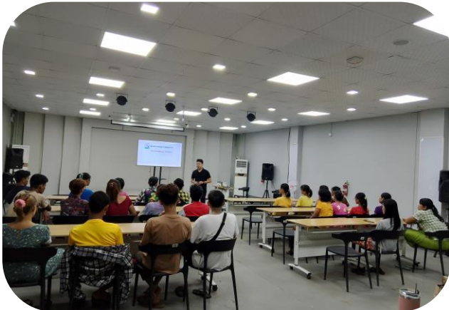
MGMA Conducting Labour Law Awareness