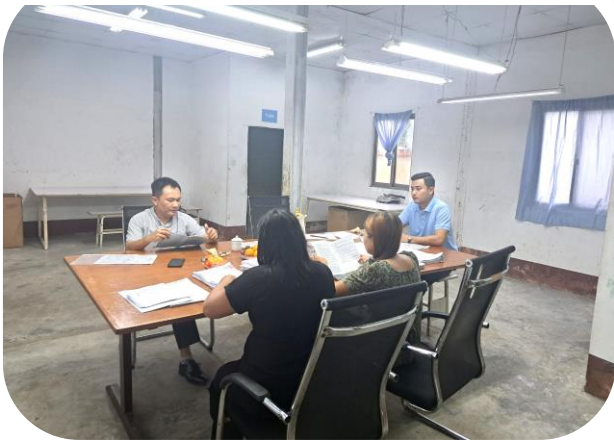
Sinoproud Myanmar Garment Co.,Ltd