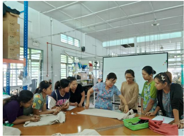
Trainer of MGHRDC presenting Sewing Method