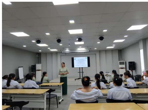
Trainer of MGHRDC presenting Sewing Method