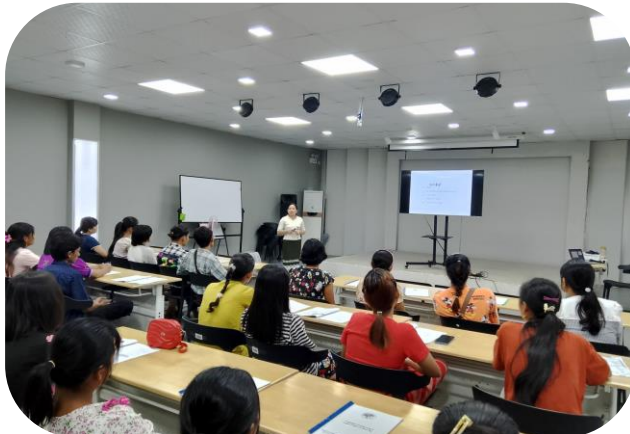
Trainer of MGHRDC presenting Sewing Method