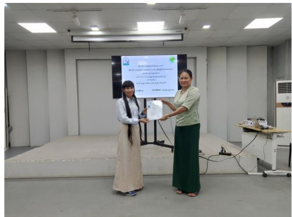
Trainer of MGHRDC presenting Sewing Method