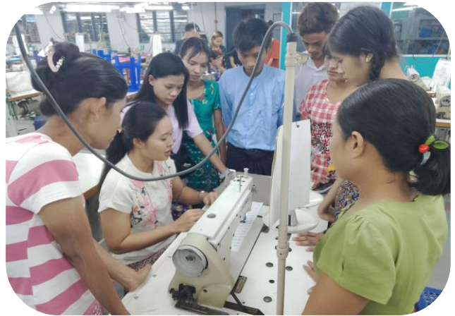
Trainer of MGRDC presenting Sewing Method