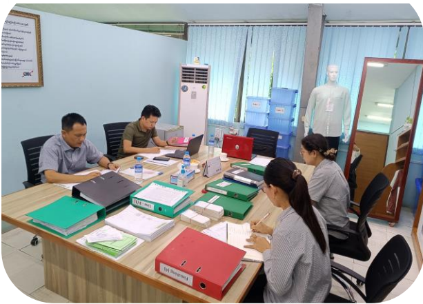
Myue & Sue Garment MFG Co.,Ltd

မိမိသဘောဆန္ဒအလျောက် အလုပ်သမားဥပဒေလေးစား လိုက်နာမှု အကဲဖြတ်စစ်ဆေးခြင်း (VLCA) အစီအစဉ်သည် ၂၀၁၉ ခုနှစ်တွင် MGMA နှင့် ILO/ACTEMP တို့ပူးပေါင်းအကောင်အထည်ဖော်ခဲ့သည့် အစီအစဉ်တစ်ခုဖြစ်ပြီး ၂၀၂၀ ခုနှစ်၊ ဖေဖော်ဝါရီလ ၁၇ ရက် တွင် တရားဝင်ကြေညာခဲ့သည်။