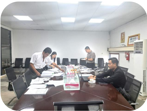
Saiform International Garment (Myanmar) Co.,Ltd