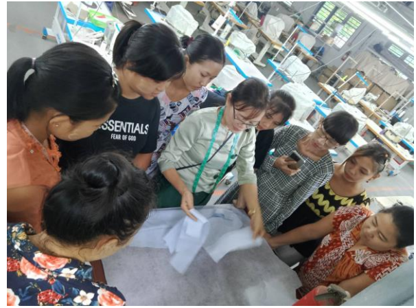
Trainer of MGHRDC presenting Sewing Method