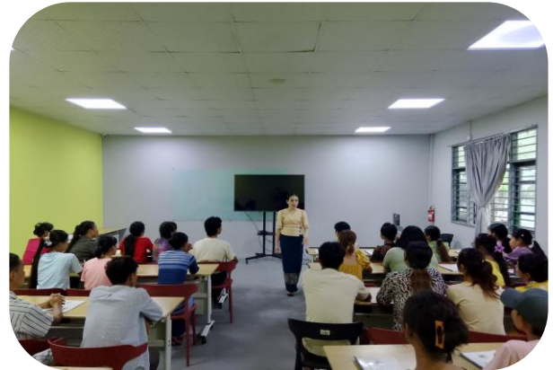
Trainer of MGHRDC presenting Sewing Method