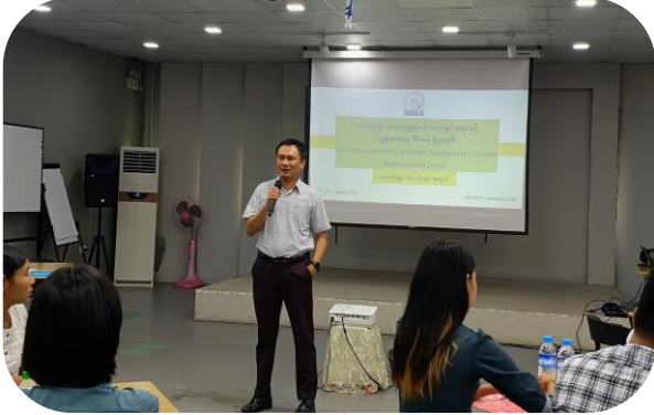
Senior Labour Officer of MGMA giving opening remarks