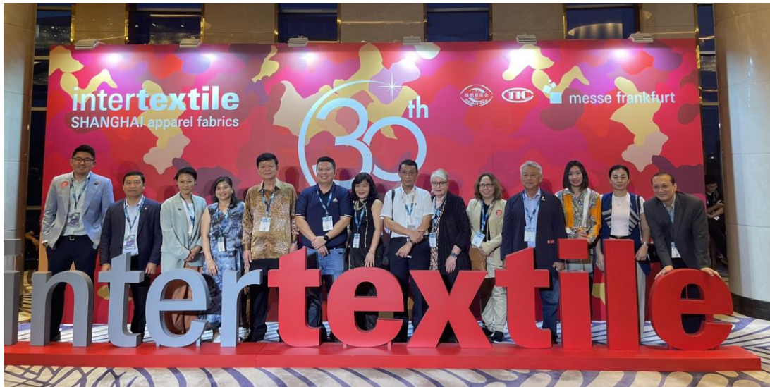
AFTEX Delegation Group Photo

InterContinental Shanghai Hongqiao Hotel ၌ ပြုလုပ်သည့် Intertextile 30 th Anniversary Gala Dinner သို့ ASEAN Federation of Textile Industries (AFTEX) အဖွဲ့ဝင်များနှင့်အတူ MGMA အလုပ်အမှုဆောင်အဖွဲ့ဝင်များနှင့် မန်နေဂျင်းဒါရိုက်တာတို့တက်ရောက်ခဲ့ကြသည်။