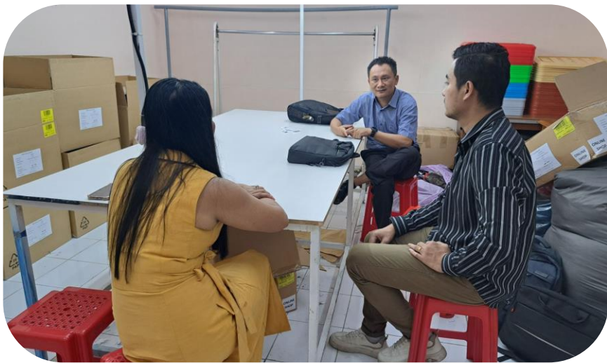
Merry Queen Co.,Ltd

MGMA ၏ Senior Labour Officer မှ ဩဂုတ်လ ၂ ရက်နေ့တွင် Merry Queen Co.,Ltd သို့ သွားရောက်ကာ VLCA အစီအစဉ်တွင်အကျုံးဝင်သည့်စာရွက်စာတမ်းအားလုံး နှင့်ကိုက်ညီမှုရှိမရှိကို အသေးစိတ်ကြည့်ရှု စစ်ဆေးခဲ့သည်။ Voluntary Labour Compliance Assessment သည် ၂၀၁၉ ခုနှစ်တွင် MGMA နှင့် ILO/ACTEMP တို့ပူးပေါင်းအကောင်အထည်ဖော်ခဲ့သည့် မိမိသဘော ဆန္ဒအလျောက် အလုပ်သမားဥပဒေ လေးစားလိုက်နာမှု အကဲဖြတ်စစ်ဆေးခြင်း အစီအစဉ်တစ်ခုဖြစ်ပြီး ၂၀၂၀ ခုနှစ်၊ ဖေဖော်ဝါရီလ ၁၇ ရက် တွင် တရားဝင်ကြေညာခဲ့သည်။