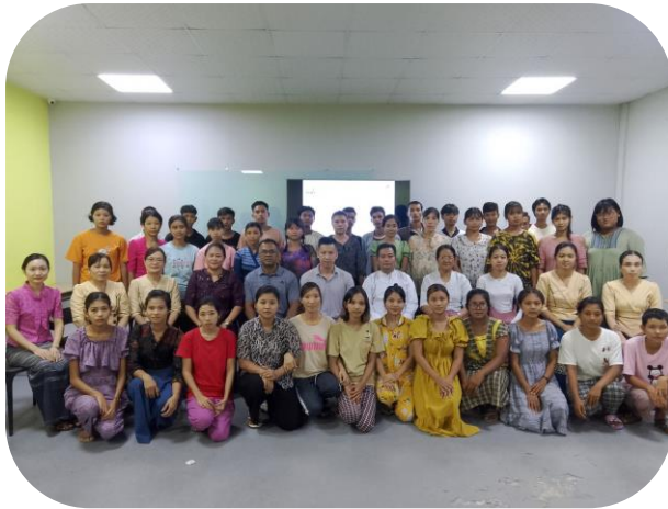
Batch - 241 Group Photo

မြန် မာနိုင်ငံအထည်ချုပ်လုပ်ငန်းရှင်များအသင်း (MGMA) မှ ကြီးမှူး၍ အခြေခံမော်တာစက် ချုပ်သင်တန်း အမှတ်စဉ် (၂၄၁) ကို ၂၀၂၄ ခုနှစ်၊ ဩဂုတ်လ ၅ ရက်မှ ၂၃ ရက်ထိ မြန်မာနိုင်ငံအထည်ချုပ် လုပ်ငန်းလှူစွမ်းအား အရင်းအမြစ်ဖွံ့ဖြိုးရေးစင်တာ (MGHRDC) ၌ပြုလုပ်ခဲ့သည်။