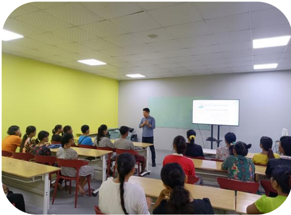
MGMA conducting Labor Law Awareness