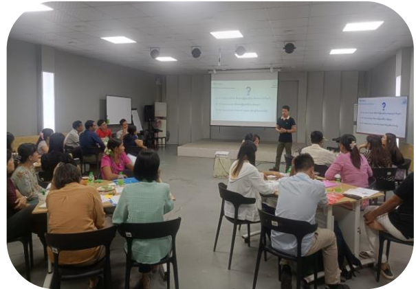
Labour Officer Team presenting OSH