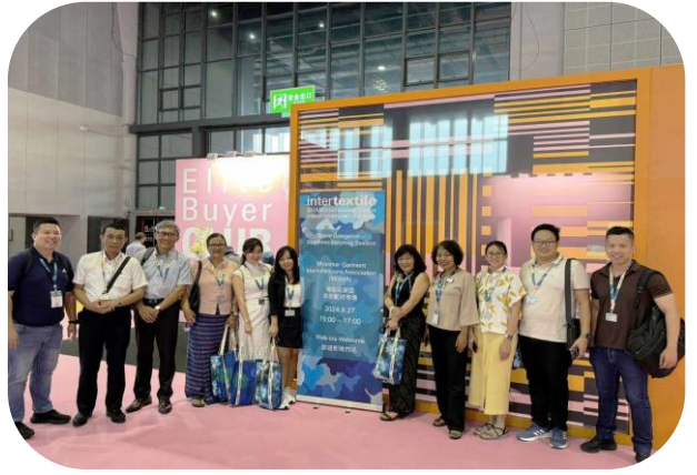
Buyer Delegates Group Photo