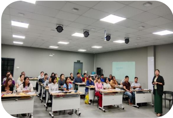
Trainer of MGHRDC presenting Sewing Method