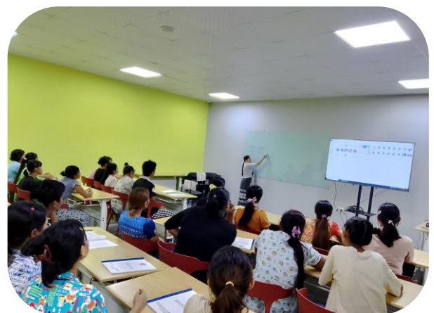
Trainer of MGHRDC presenting Sewing Method