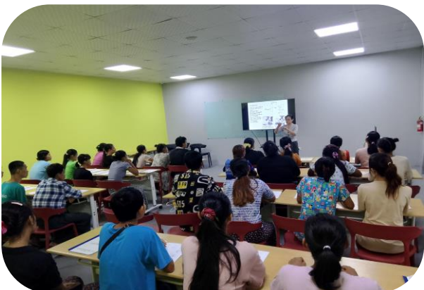
Trainer of MGHRDC presenting Sewing Method