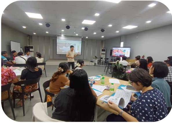
Labour Officer Team presenting OSH