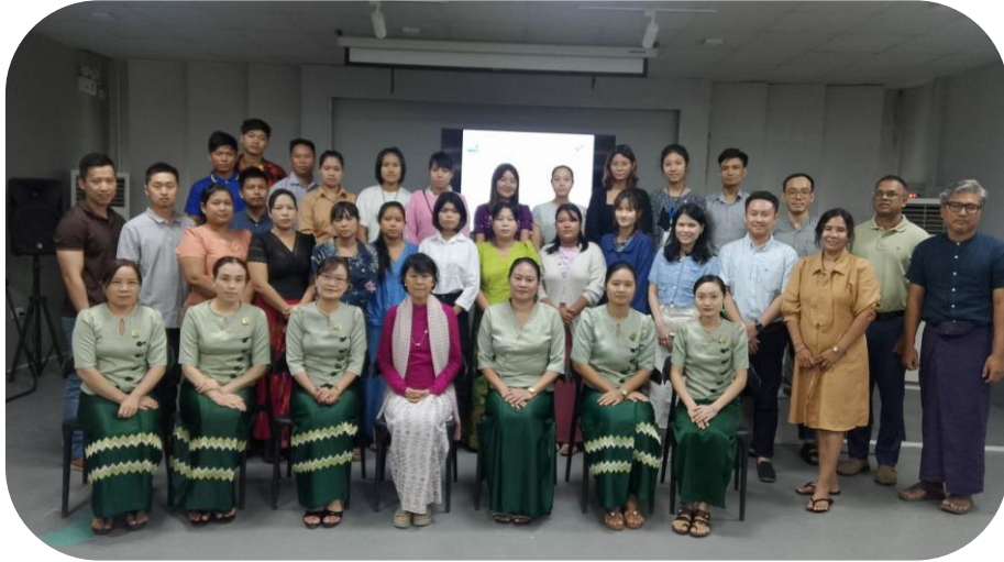
Batch – 81 Group Photo

မြန်မာနိုင်ငံအထည်ချုပ်လုပ်ငန်းရှင်များအသင်း (MGMA) မှကြီးမှူးပြီး အထည်ချုပ်စက်ရုံများ အတွက် Industrial Engineering Training (သင်တန်းအမှတ်စဉ် - ၈၁) ကို ၂၀၂၄ ခုနှစ်၊ ဇူလိုင်လ ၂၉ ရက်မှ ဩဂုတ်လ ၉ ရက်ထိ မြန်မာအထည်ချုပ်လုပ်ငန်းလှူစွမ်းအားအရင်းအမြစ်ဖွံ့ဖြိုးတိုးတက်ရေး စင်တာ (MGHRDC) ၌ပြုလုပ်ခဲ့သည်။