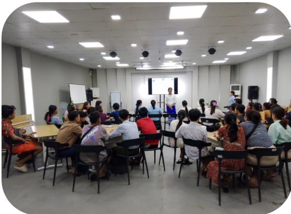
Associate Professor of GTHS giving Closing Remarks

ချုပ်နည်းအဆင့်ဆင့်များကို လက်တွေ့သင်ကြားမှုများဖြင့် သင်ကြားပေးခဲ့ပြီး MGMA မှအလုပ်သမားဥပဒေဆိုင်ရာ သိကောင်းစရာများကို ရှင်းလင်းပြောကြားပေးခဲ့သည်။ သင်တန်းသို့ သင်တန်းသား (၃၁) ယောက်တက်ရောက်ခဲ့ပြီး သင်တန်းဆင်းလက်မှတ်များ ပေးအပ်ခဲ့သည်။