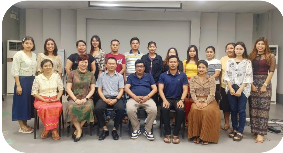
Batch - 4 Group Photo

Garment HR Management and Occupational Safety & Health Management System (OSH) သင်တန်း အမှတ်စဉ် - ၄ ကို ၂၀၂၄ ခုနှစ်၊ နိုဝင်ဘာလ ၁၉ ရက်မှ ၂၁ ရက်ထိ မြန်မာနိုင်ငံအထည်ချုပ်လုပ်ငန်း လူ့စွမ်းအားအရင်းအမြစ် ဖွံ့ဖြိုးတိုးတက်ရေးသင်တန်းကျောင်း (MGHRDC) ၌ပြုလုပ်ခဲ့သည်။