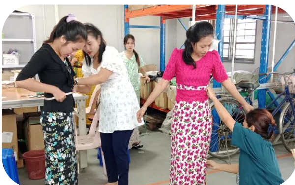
Trainer of MGHRDC presenting advanced sewing method