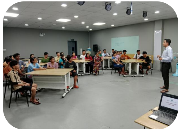
MGMA conducting Labor Law Awareness