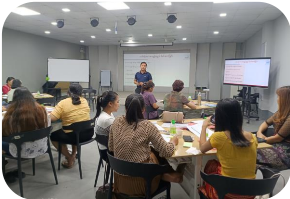
Junior Labor Officer of MGMA presenting OSH