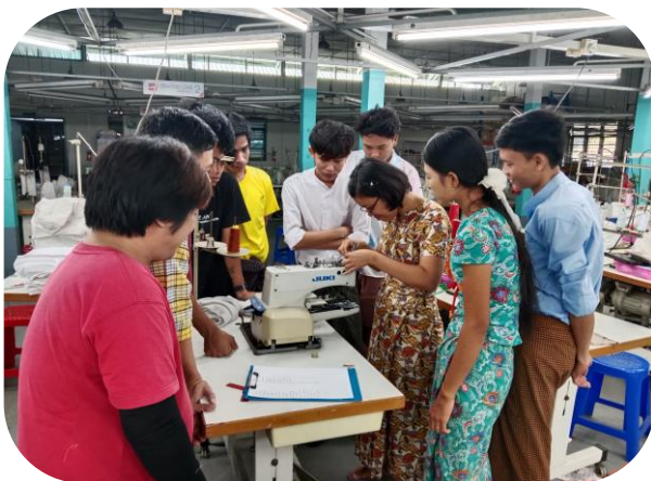
Trainer of MGHRDC presenting Sewing Method