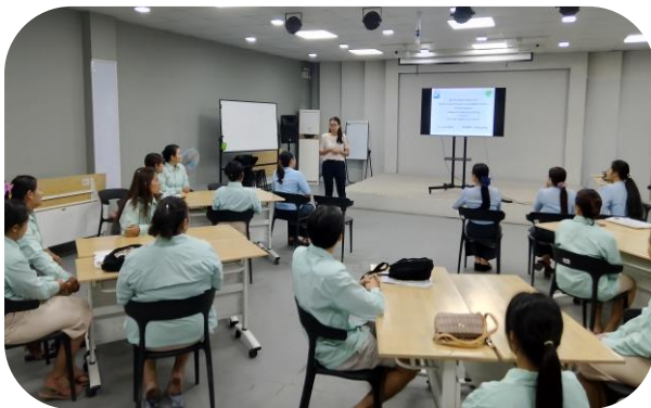
Executive Committee of MGMA giving closing remarks