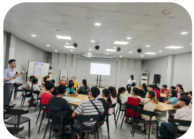
Trainer of MGHRDC presenting Sewing Method