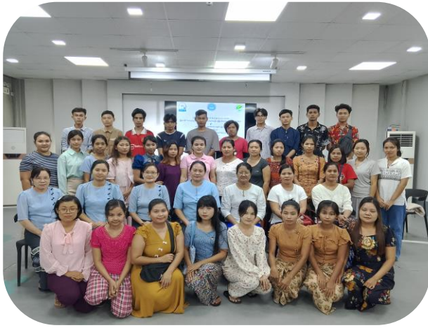
Batch - 246 Group Photo

မြန်မာနိုင်ငံအထည်ချုပ်လုပ်ငန်းရှင်များအသင်း (MGMA) မှ ကြီးမှူးပြီး အခြေခံမော်တာစက်ချုပ်သင်တန်း အမှတ်စဉ် (၂၄၆) ကို ၂၀၂၄ ခုနှစ်၊ နိုဝင်ဘာလ ၁၈ ရက်မှ ဒီဇင်ဘာလ ၆ ရက်ထိ မြန်မာနိုင်ငံအထည်ချုပ်လုပ်ငန်းလှူစွမ်းအားအရင်းအမြစ် ဖွံ့ဖြိုးရေးစင်တာ (MGHRDC) ၌ပြုလုပ်ခဲ့သည်။