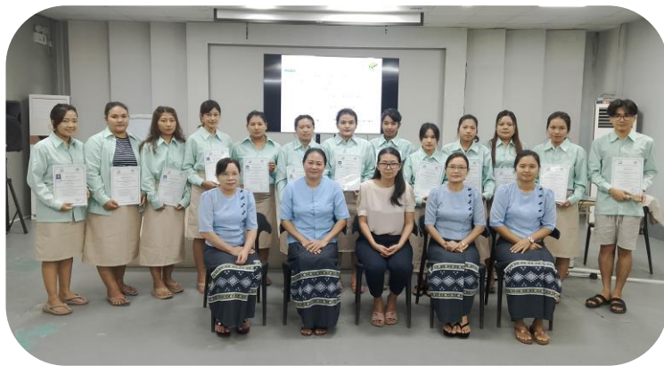
Batch - 9 Group Photo

သင်တန်းတွင် MGHRDC သင်တန်းကျောင်းမှ ဆရာမများက အထည်တစ်ခု၏ အစိတ်အပိုင်းများဖြစ်သော (အိတ်ဖုံး၊ ခရုပတ်၊ ပုခုံးဒေါက်၊ အိတ်ကပ်၊ ဖောက်အိတ်ပုံစံအမျိုးမျိုး၊ ရိုးရိုးစေ့တပ်နည်း၊ စေ့ပျောက်တပ်နည်း၊ ကျားဝတ်ဂျာစီ(သင်္ဘောသားလျှာချုပ်နည်း)၊ ရှုပ်အင်္ကျီလက်ရှည်တစ်ထည်လုံးချုပ်နည်း၊ ခါးပတ်ပါတဲ့ A Skirt တစ်ထည်လုံးချုပ်နည်းများကိုသင်ကြားပေးသွားမည့်အပြင် အထူးစက်ချုပ်သင်တန်း (၆) မျိုးဖြစ်သော ကြယ်သီးဖောက်စက်အသုံးပြုနည်း၊ ကြယ်သီးတပ်စက်အသုံးပြုနည်း၊ Bartack Machine, Overlock 4 thread, Overlock 5 thread, 2 Needle များကို သင်ကြားပေးခဲ့သည်။ လက်တွေ့လုပ်ဆောင်မှုများပါဝင်သည့်သင်တန်းသို့ သင်တန်းသား (၁၃) ဦးတက်ရောက်ခဲ့သည်။