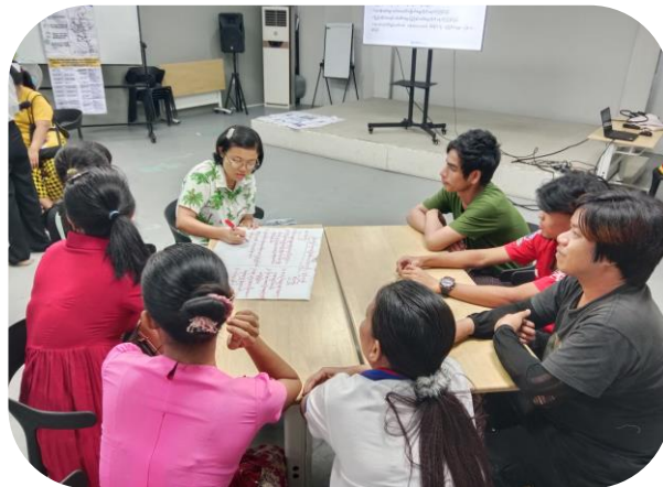
Trainer of MGRDC presenting Sewing Method