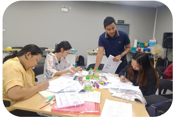
Junior Labor Officer of MGMA presenting OSH