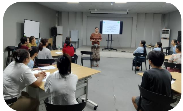
Manager of MGMA presenting advanced sewing method