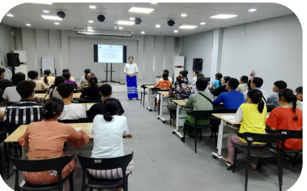
Associate Professor of GTHS giving opening Remarks