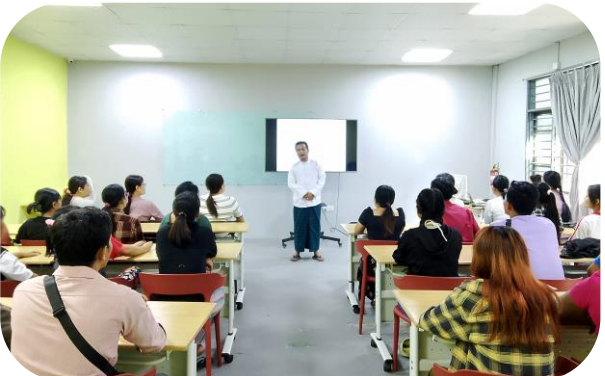
Principle of GTHS giving Closing Remarks