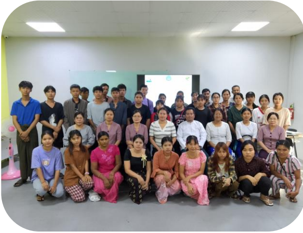
Batch - 247 Group Photo

မြန် မာနိုင်ငံအထည်ချုပ်လုပ်ငန်းရှင်များအသင်း (MGMA) မှ ကြီးမှူးပြီး အခြေခံမော်တာ စက်ချုပ်သင်တန်း အမှတ်စဉ် (၂၄၇) ကို ၂၀၂၄ ခုနှစ်၊ ဒီဇင်ဘာလ ၉ ရက်မှ ၂၇ ရက်ထိ မြန်မာနိုင်ငံအထည်ချုပ်လုပ်ငန်းလှူစွမ်းအားအရင်းအမြစ် ဖွံ့ဖြိုးရေးစင်တာ (MGHRDC) ၌ပြုလုပ်ခဲ့သည်။