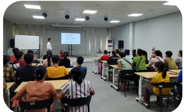
MGMA conducting Labor Law Awareness