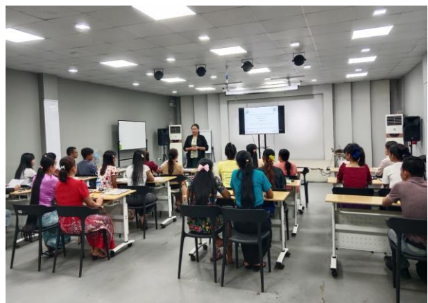
Manager of MGHRDC presenting IE