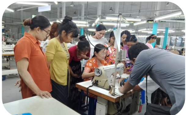
Trainer of MGHRDC presenting Sewing Method