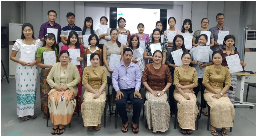
Batch – 83 Group Photo

မြန် မာနိုင်ငံအထည်ချုပ်လုပ်ငန်းရှင်များအသင်း (MGMA) မှကြီးမှူးပြီး အထည်ချုပ်စက်ရုံများအတွက် Industrial Engineering Training (သင်တန်းအမှတ်စဉ် - ၈၃) ကို ၂၀၂၄ ခုနှစ်၊ ဒီဇင်ဘာလ ၁၆ ရက်မှ ၂၇ ရက်ထိ မြန်မာအထည်ချုပ်လုပ်ငန်းလှူစွမ်းအားအရင်းအမြစ်ဖွံ့ဖြိုးတိုးတက်ရေး စင်တာ (MGHRDC) ခွဲပြုလုပ်ခဲ့သည်။