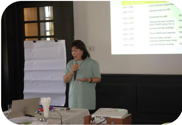
MD of MGMA giving opening remarks

M GMA Staffs' Team Building Workshop အား ၂၀၂၄ ခုနှစ်၊ ဒီဇင်ဘာလ ၂၈ ရက်နှင့် ၂၉ ရက်တွင် ပြင်ဦးလွင်မြို့ရှိ Aurerum Palace Hotel ၌ ပြုလုပ်ခဲ့သည်။