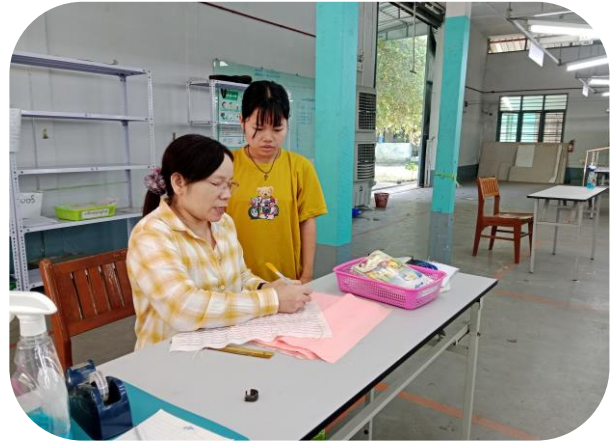
Trainer of MGRDC presenting Sewing Method