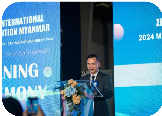
Commercial Counselor of Chinese Embassy Mr.Ouyang DaoBing giving greeting message