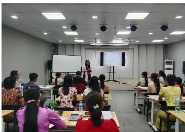
Executive Committee of MGMA giving opening remarks