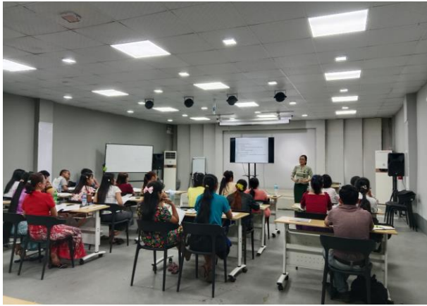
Assistant Manager of MGHRDC presenting IE